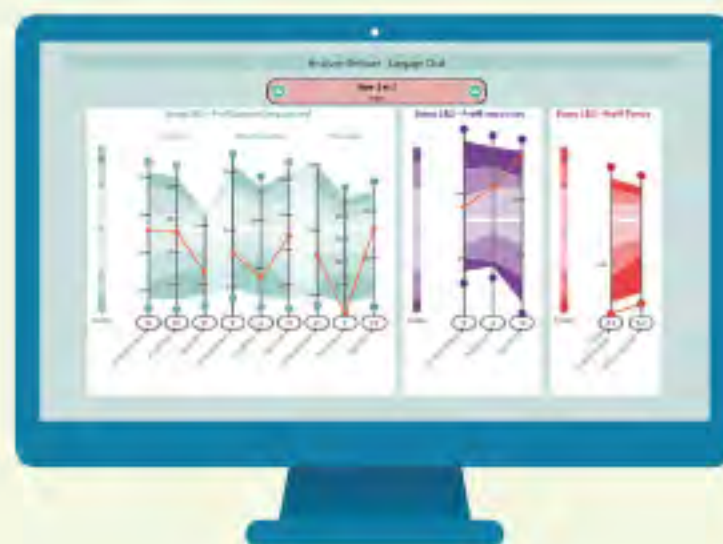
PROFIL DU PATIENT