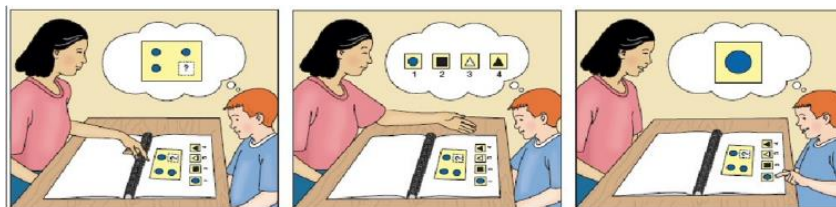
Epreuve « Matrices » au WNV

Les supports visuels et les questions illustrées peuvent en général faciliter la compréhension de la consigne et par le fait même indiquer à l'enfant l'action à entreprendre. Dans le WNV, Wechsler Non Verbal (Wechsler et Naglieri, 2009), épreuve d'intelligence destinée à une tranche d'âge allant de 4 à 21 ans 11 mois et qui ne nécessite pas le langage oral, les consignes et les directives sont illustrées. Les différents subtests mesurent, entre autres, le raisonnement perceptif et la vitesse de traitement ( matrices, assemblage d'objets, arrangement d'images, code ) ainsi que la mémoire ( reconnaissance, mémoire spatiale ).